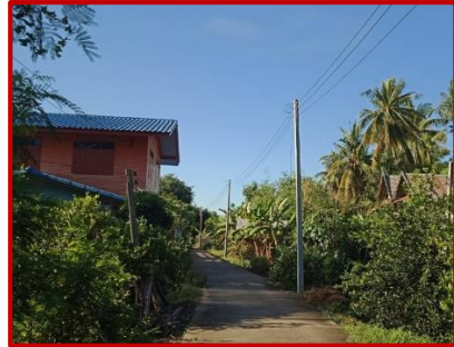
โครงการขยายเขตไฟฟ้าสาธารณะ(สายบ้านนายสมเกียรติ-บ้านลุงเกตุ) หมู่ที่ ๒ ต.ดอนก่า