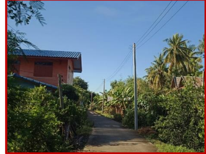
โครงการขยายเขตไฟฟ้าสาธารณะ(สายบ้านนายสมเกียรติ-บ้านลุงเกต) หมู่ที่ ๒ ต.ดอนก่า